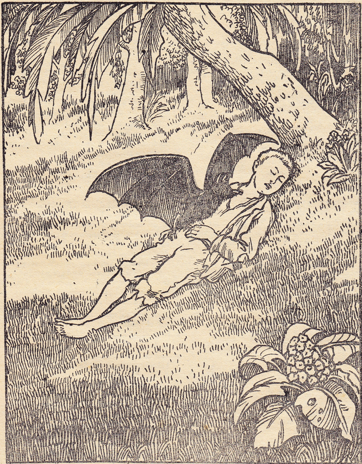
Het was een vampier (Blz. 744).